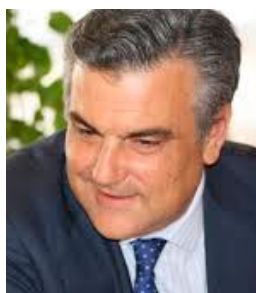
JESÚS SILVA FERNÁNDEZ (Sevilla, España, 1962)

Diplomático español, actual embajador de España en Venezuela. Ha sido consejero técnico en la Jefatura de Protocolo de Presidencia del Gobierno, cónsul general de España en Rosario y